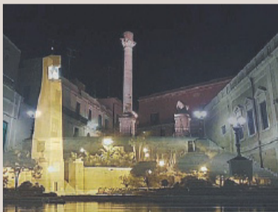
Principali monumenti di Brindisi

N on tutti i cittadini provano interesse per la cura della città. Spesso, a volte non rendocene conto, facciamo del male alla città, alla natura e quindi a noi stessi. In questo momento passeggiamo per il parco Cesare Braico, e pur essendo bellissimo riteniamo sia stato un po' abbandonato dal Comune.