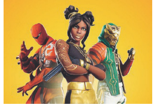
Personaggi del gioco Fortnite