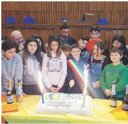
Festeggiamenti con il Sindaco dei ragazzi