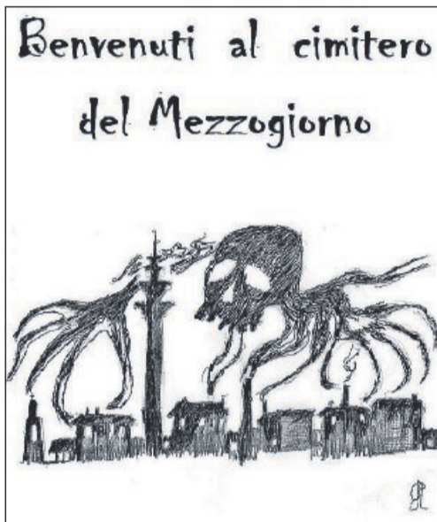
Grafico che simboleggia un'alta canna fumaria sulla città

giocare, tutta la gente terrorizzata. Tutta la gente è corsa ai ripari e non vedo più i miei amici. Non riesco più a sopportare questo. Spero di trovarmi bene da te, che mi hai sempre reso felice anche nei