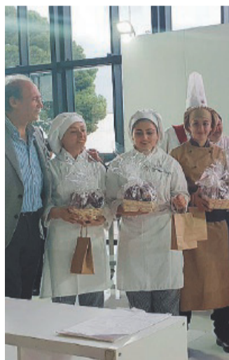
Al "Gate & Gusto", sul podio la squadra cuochi Einaudi