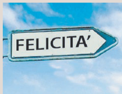
La ricerca della felicità

La felicità è una condizione di vita che aiuta l'individuo a vivere in uno stato di benessere con il proprio io. Ogni persona cerca la felicità in base al proprio stile di vita e obiettivi. I giovani cercano la felicità in un lavoro per costruire un futuro migliore; o in un amore sperando sia corrisposto; altri cercano la felicità in cose materiali come l'auto, i soldi o vestiti e non riflettono sul fatto che ci sono Paesi dove la felicità è avere l'acqua.