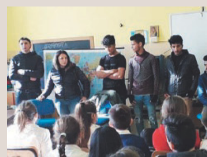
Ragazzi egiziani e pakistani in aula

C'è attesa e fermento nella scuola "Don Bosco": gli alunni incontrano sei ragazzi, provenienti dall'Egitto e dal Pakistan, ospiti presso la Comunità Educativa per minori "Chora&Angelide" di Otranto e studenti presso l'Istituto Alberghiero. Sollecitati dalle domande ricordano e raccontano il lungo e duro viaggio in un mare che sembrava non finire mai, su barche affollate con pochi centimetri di spazio per muoversi, senza acqua e cibo e con la paura di essere gettati in mare. Con occhi lucidi parlano della famiglia, la "cosa" più preziosa che hanno lasciato nelle loro terre, martoriata dalla povertà e dalle guerre.