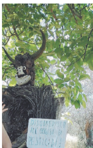
Attività laboratorio Parco Paduli