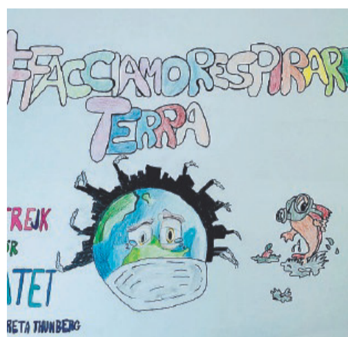
DISEGNO degli alunni dell'IC di Latiano

A questo tema si ispira anche l'opera teatrale realizzata dalla Classe 1a D della Scuola Secondaria di Primo Grado Croce-Monasterio. Lo spettacolo nasce da un laboratorio sull'improvvisazione attoriale e la scrittura collettiva, ispirato alle tecniche del teatro integrato. L'opera sarà messa in scena verso la fine del mese di maggio.