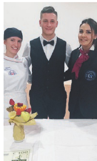
I TRE STUDENTI vincitori della Gara Interna

Una grande esperienza per i ragazzi che si sono confrontati con tante altre realtà.