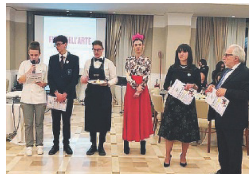
«IN CUCINA con Arte»