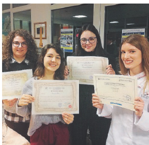
ALCUNE studentesse premiate