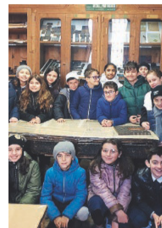
RAGAZZI in visita alla Tipografia Portoghese di Altamura