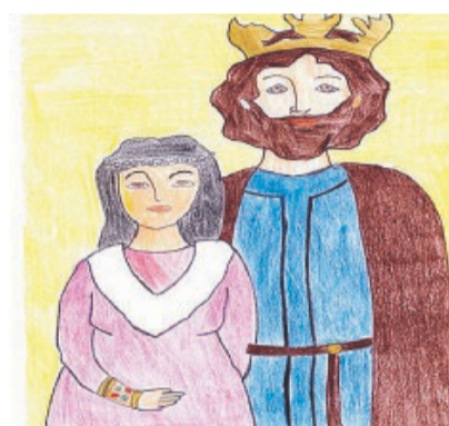
DISEGNO degli alunni della Primaria

Q uest'anno ad Altamura ricorre l'ottava edizione della grande festa Medievale in onore dell'imperatore Federico II di Svevia per rievocare, secondo la leggenda, il suo passaggio dalla città mentre era diretto a Bari per salpare verso la Terra Santa. Dal 25 al 28 Aprile, il centro storico di Altamura si trasformerà in una vera e propria città medievale, ritornerà al passato per rivivere "LI AGI", gli svaghi e i divertimenti concessi alle corti di Federico II. È un evento culturale che coinvolge tutte le fasce di età. Gli alunni delle classi quinte del 1° C.D. "IV Novembre" parteciperanno al corteo storico rappresentando i personaggi della corte federiciana: nobili, cortigiani, crociati, popolani. Sfileranno con abiti dell'epoca, accompagnati dal ritmo