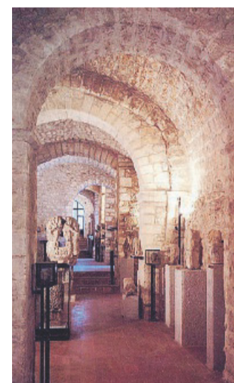
Museo lapidario, Santuario di San Michele, Monte Sant'Angelo