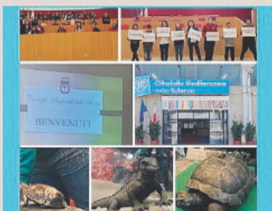
VISITA al Consiglio Regionale