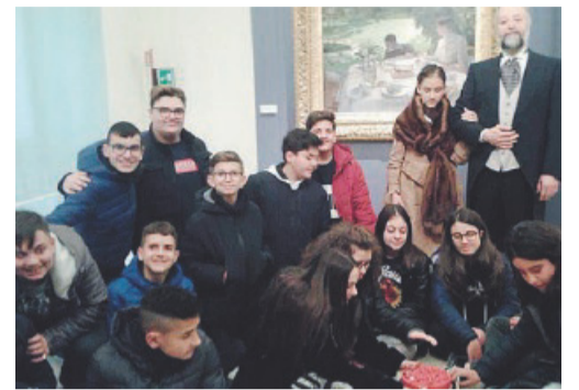
IN RICORDO di Giuseppe De Nittis