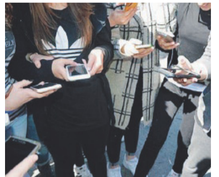
I CELLULARI cuore e anima dei ragazzi

“C ellulari e tablet assorbono cervello, anima e cuore di noi ragazzi”, è quanto afferma un'inchiesta di Jean Twenge, docente alla San Diego University. Ormai la "generazione iPhone" trascura famiglia, amici, fidanzatini e volontariato, smarrita nell'uso eccessivo del cellulare. In classe spesso si è affrontato l'argomento, discutendo se Facebook, ad esempio, ci aiuta a contattare più amici o, al contrario, a renderci più solitari. La risposta è stata unanime: siamo tutti dipendenti del piccolo schermo e, quindi, molto soli. Ma come se ne esce? E' necessario posare i telefoni, un ordine da impartire a scuola, in famiglia, ovunque si passi del tempo. Nelle scuole molti docenti lo fanno, altri usano una didattica tecnologica. Se ne parla ovun-