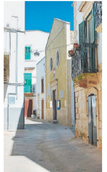
Classe III B Il Borgo antico di Noci

ospitali, animano il paese e sono affezionati alle tradizioni e alle feste religiose: Santa Lucia, San Rocco, San Giovanni che sono i momenti più caratteristici da vivere, senza nulla da invidiare ad altre città.