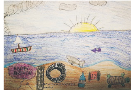
Disegno di Francesco Giacobelli sul futuro del pianeta