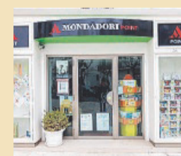
EDICOLA AMICA: Mondadori Point, Los Primos, via Cavour, 143