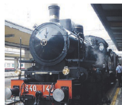
Un treno a vapore

Quando tutto si pensava fosse perduto in nome dell'alta velocità e deisupertreni, ecco la voglia di riutilizzare quei treni d'un tempo a scopo turistico, per far godere, dal finestrino delle carrozze, paesaggi inconsueti e dimenticati. Le partenze a bordo dei treni storici prevedono diversi itinerari: un salto indietro nel tempo su carrozze vintage, grazie alla Fondazione FS che promuove il restauro di carrozze, locomotive e sta-