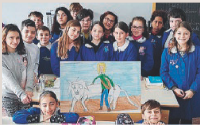
Al cinema con Mia e il suo leone

L o scorso febbraio, noi alunni della Minzele, abbiamo avuto l'opportunità di andare a cinema a vedere l'emozionante film "Mia e il leone bianco" che ha incantato tutti noi bambini e ci ha permesso di riflettere riguardo all'insensibilità dell'uomo nei confronti degli animali che invece andrebbero protetti, soprattutto se sono in via d'estinzione.