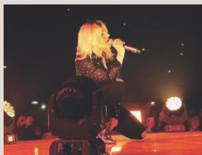
Emma Marrone in concerto a Bari

N el territorio pugliese, un ruolo importante è occupato dalla musica con i suoi numerosi artisti. Tra i più noti: Domenico Modugno, i Negramaro, Al Bano Carrisi, Caparezza, Alessandra Amoroso, i Boomdabash, Elodie, Emma Marrone e Dolcenera. Alcuni sono riusciti a fare carriera attraverso i Talent Show, tra questi Alessandra Amoroso nata a Galatina, vincitrice di "Amici".