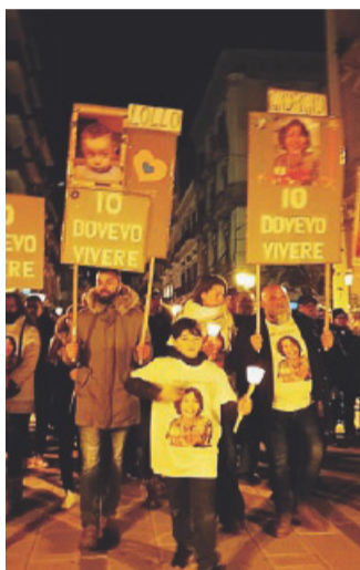
il corteo di fiaccolate svoltosi a Taranto