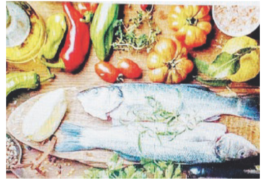
Alcuni prodotti per la dieta mediterranea