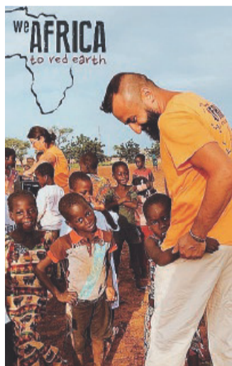
Bambini africani pieni di gioia e amore