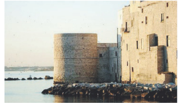
Il Torrione Passari

Gli alunni più piccoli, dopo approfondite ricerche sulla storia del monumento, hanno drammatizzato il momento storico denominato: il Sacco di Molfetta, avvenuto agli inizi del 1500