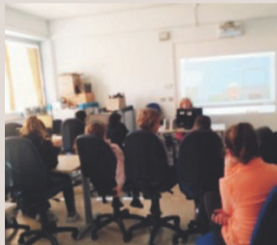
Una lezione in laboratorio

Per l'occasione abbiamo visto filmati di animazione a tema. Ci ha colpito molto il video "il potere delle parole" che ne spiegava i danni potenziali. Per il concorso abbiamo progettato un gioco finalizzato ad un regolamento in internet. Il gioco è "l'Amicometro".