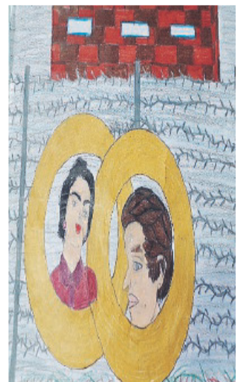
Millie e heiniek ritratti nelle loro fedi