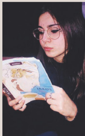
Un'alunna con il romanzo storico