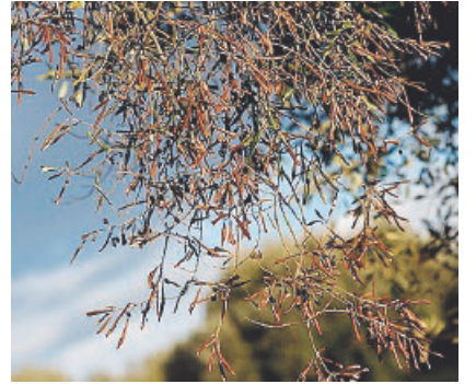
IL FENOMENO Xylella

S ono passati 10 anni da quando gli agricoltori salentini osservarono che alcuni olivi seccavano dalle cime verso il tronco. Solo nel 2013 il fenomeno riguardava già 8.000 ettari. Le analisi di laboratorio hanno dato un esito preciso: CoDiRO, Complesso di Disseccamento Rapido dell'Olivio, una malattia provocata dal batterio Xylella Fastidiosa che causa l'ostruzione dei vasi linfatici fino a provocare la morte dell'albero nel giro di 3-4 anni. Si può limitarne la diffusione utilizzando fitofarmaci, sradicando le piante infette e quelle circostanti. D'altro canto, la comunità scientifica si è divisa su teorie contrapposte che non hanno dato la certezza sul da farsi. Intanto poche settimane fa è stato rilevato un olivo infetto nell'agro di Monopoli; così dal Salento la minaccia si estende ora alla