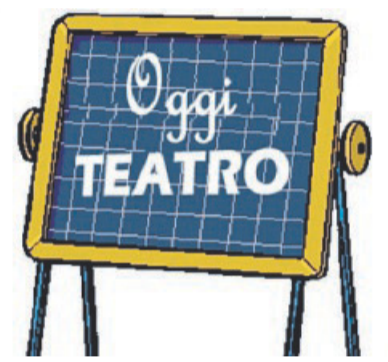
Teatro a scuola

G li alunni delle classi quinte della scuola primaria "G. Tauro", guidati dalle docenti di italiano, sono protagonisti di un progetto teatrale che li vede impegnati nella realizzazione di uno spettacolo. La sceneggiatura, scritta dal prof. Franco Lestingi, tratta di una storia fantastica ambientata su un pianeta sconosciuto e sulla Terra: otto bambini, scelti dallo spirito maligno delle Nebulose Spente, avranno il compito di svelare l'enigma della Porta del Tempo. In questo loro cammino, con l'aiuto di una zingara, incontreranno personaggi fantastici e dovranno superare mille ostacoli e pericoli. Durante la loro avventura saranno in collegamento con un gruppo di amici del pianeta Terra. Grande la partecipazione e l'interesse per l'attività tea-