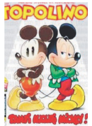
L'intramontabile fumetto «Topolino»