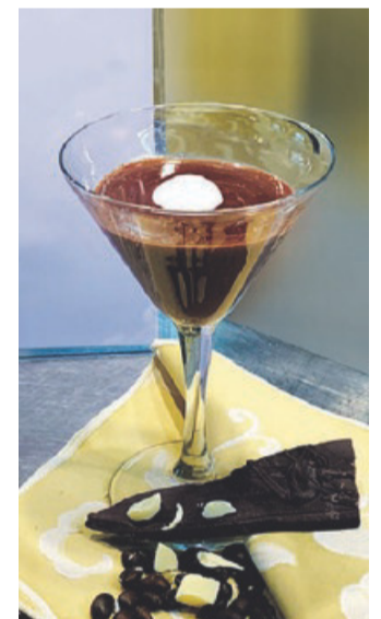
Un cocktail sano