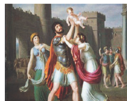
Nelle pagine dell'Iliade si riscoprono i valori importati

L' amore, il sentimento più importante per l'uomo, sembra aver perso le caratteristiche che lo rendevano tale. Basta ascoltare la cronaca in cui donne subiscono violenze dal loro amato o dare uno sguardo alle statistiche dei matrimoni duraturi che tendono a diminuire. Sembra opportuno oggi riscoprire i valori umani, i sentimenti cantati da Omero nell'Iliade. Un canto che ha destato l'attenzione degli alunni della I A è stato il sesto, in cui i protagonisti sono Ettore e Andromaca. Durante la guerra che fa da sfondo con la sua crudeltà, gli amanti danno vita ad un barlume di umanità accennando a emozioni contrastanti: la paura di Andromaca di perdere l'amato e l'onore per l'armatura di Ettore. Il canto mette in luce i grandi valori dell'epoca: coraggio e senso di appar-