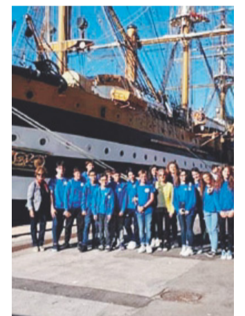
Gli alunni della Busciolano davanti alla "Vespucci"