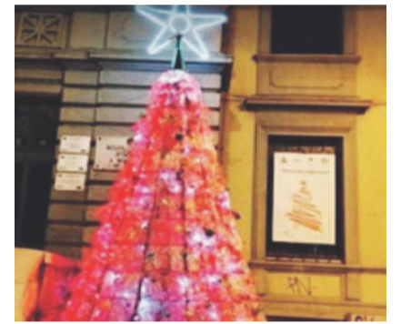
L'albero di Natale della riciclata

L' Istituto Comprensivo "A. Busciolano" consente la partecipazione a numerosi progetti didattici ma particolare attenzione viene riservata all'educazione ambientale. Molte, infatti, le iniziative programmate su questo tema. Un progetto veramente interessante è stato "Bee-green", svolto a Potenza nel rione di Macchia Romana, in collaborazione con "Legambiente". Abbiamo assistito alla produzione del miele ed appreso molto sulla biodiversità. Nell'anno scolastico in corso, con il progetto "School4energy", stiamo imparando, inoltre, come è possibile evitare gli sprechi di energia assumendo comportamenti sostenibili. Altre iniziative realizzate da noi studenti, sul tema della natura e del riciclo, sono state: la "Festa dell'albero", e "L'al-