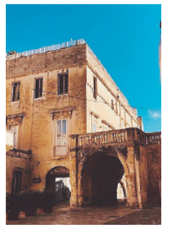
PIAZZETTA ARCO DI PRATO