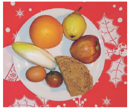
CIBO PER "ROBOT"

Potranno mai i robot convivere con l'uomo? Il cinema propone mondi abitati da uomini e robot umanoidi lasciando intendere come la loro convivenza sia prossima. Gli studi sulla loro evoluzione confermano tale ipotesi. Ma il problema più grande da risolvere è la loro indipendenza energetica. I robot attuali sono alimentati dalla rete elettrica; per convivere con l'uomo devono avere un'autonomia costante nel tempo, e gli studi per migliorare la tecnologia delle batterie attuali sembrano non fare progressi. La meta è ancora lontana. Da più parti del mondo sono state avviate ricerche futuristiche con il fine di produrre robot in grado di autosostenersi come fanno tutti gli esseri viventi: estrarre energia ingerendo cibo. Quali sono stati i risultati? Finora molti