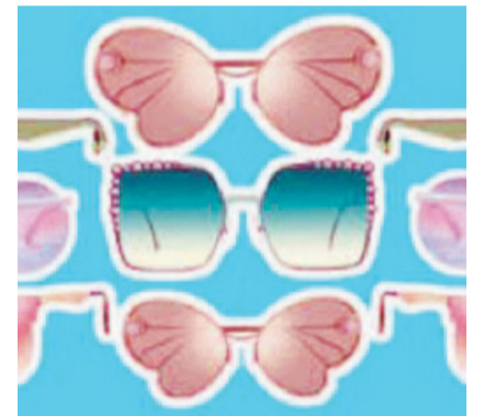
Gli occhiali oggetto di tendenza

È sempre più frequente che molti, soprattutto i giovani utilizzino gli occhiali come accessorio di moda. Sicuramente questo sarà collegato ai social; per uscire meglio nelle foto oppure per fare più like. I giovani pensano che gli occhiali diano un'area più intellettuale. Un tempo era normale indossare gli occhiali per problemi di vista reali. I modelli non erano particolarmente accattivanti, ce ne erano di grandi, piccoli... e i colori? Nero o Marrone. Oggi gli occhiali non sono più soltanto dei supporti visivi ma anche degli accessori di tendenza. Come il tempo anche loro cambiano di stagione in stagione, forma e colore. Un esempio? È Elton John il più emblematico tra gli appassionati degli occhiali, con lui le montature sono diventate dei veri e propri must. Ed ecco che le montature